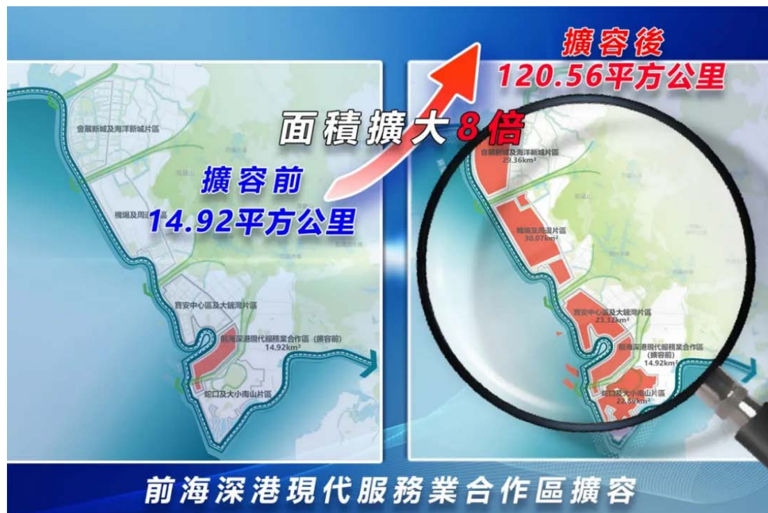
图 1 前海扩区范围

宝安中心区及大铲湾片区（东至宝安大道，南至双界河，西至海岸线，北至金湾大道、宝源路、碧湾路，另包括大小铲岛、孖洲岛） 23.32 平方公里。