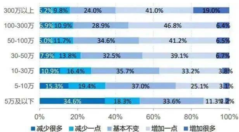
图 2 家庭财富变化(按金融资产分组)