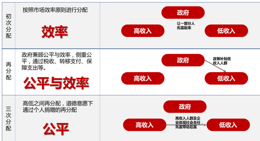
图1 分配的三个层次

最后是第三次分配，因为无论是市场还是政府，在收入分配中总有不那么尽善尽美的地方，因此需要公益慈善组织和志愿者来做一些补充。第三次分配以自愿为原则，以道德力为驱动。目前来看，我国第三次分配还处在非常基础的阶段。中共中央党校曾引用过一组数据：2018年我国内地捐赠额占GDP总量比例仅为0.16%，而发达国家该比例通常都在1%以上，美国仅个人捐献就占到GDP的2%以上。我国志愿者服务参与率仅为全国人口的3%，而美国则为44%。未来随着公益慈善事业配套制度的推进，我国的第三次分配还有很大发展空间。