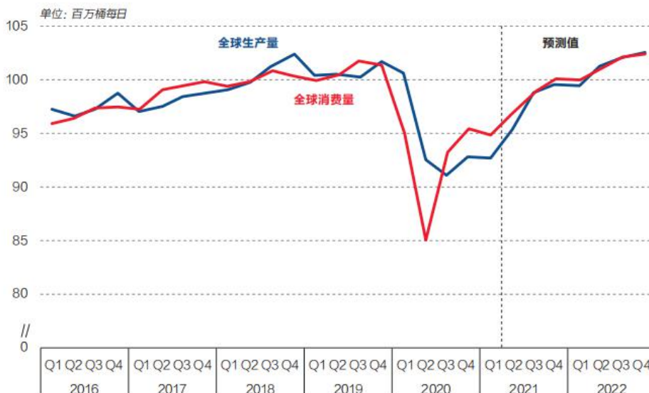
图3: 液态燃料的全球生产、消费力量对比

从市场预期来看，2021 年物价上涨压力主要体现在生产端，而在消费端的物价涨幅压力较小。WIND 综合预测显示，市场预期认为 PPI 全年涨幅在 4%—5% 之间，而 CPI 通胀率全年涨幅将明显低于政府工作报告中 3% 左右的预期目标。从趋势上来看，CPI、PPI 通胀率同比涨幅都将在年中达到高点，并在下半年有不同程度的回落。其中生产端的通胀压力和大宗商品价格上涨有关。大宗商品价格的后续走势对于判断通胀的走向比较关键。和疫情之前对比，2021 年一季度的液态燃料全球消费量、生产量均显著低于 2019 年水平（美国能源信息署的数据）。但是 2021 年一季度的能源价格已经高于 2019 年水平。