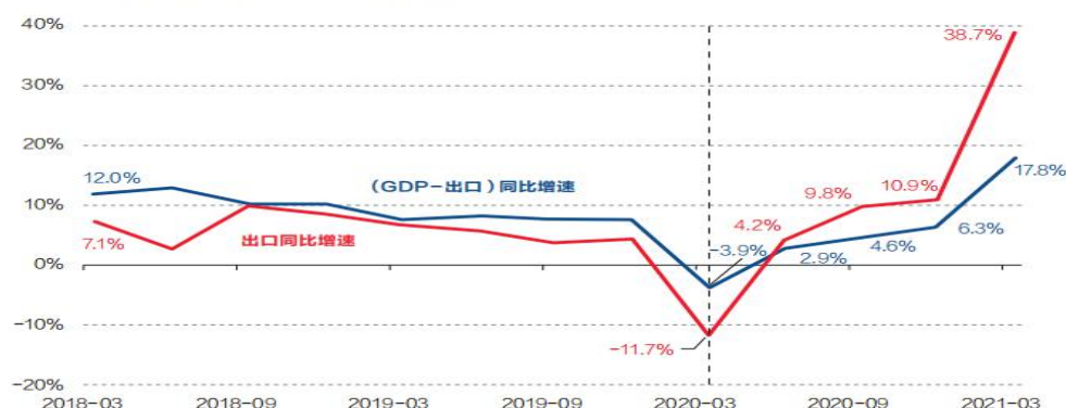
图1：疫情以来外需扩张持续强于内需