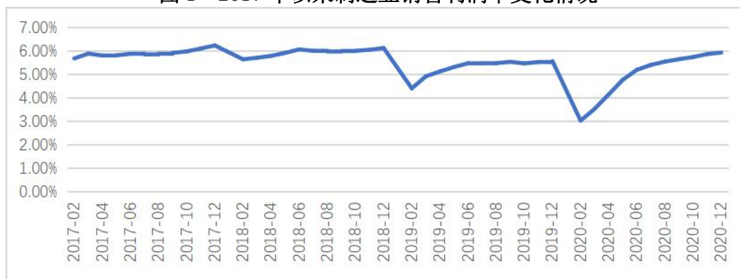
图1 2017年以来制造业销售利润率变化情况

(二) 产业内卷直接导致部分行业难以摆脱产能过剩制约。内卷情况下,部分行业由于企业普遍缺乏核心竞争力,难以走出产能过剩的困境,新兴产业在地方政府扎堆投资驱动下也呈现快速产能过剩的情况,这些都导致了中国制造业总体上难以摆脱产能过剩的恶咒。2016年以来,中国制造业整体产能利用率为73.9%,此后年度虽然有所提升,但一直低于80%的水平,呈现出产能利用不足、生产效率不高的局面。从具体行业看,除化学纤维制造业略高于80%外,多数产业大部分年份产能利用率也低于80%(见表1)。近年来,半导体、互联网等新兴产业由于缺乏有效行业管理和引导,盲目上马和无序竞争,不仅对传统行业带来巨大冲击、造成社会资源的巨大浪费,还面临整个产业难以实现良性发展的困境。