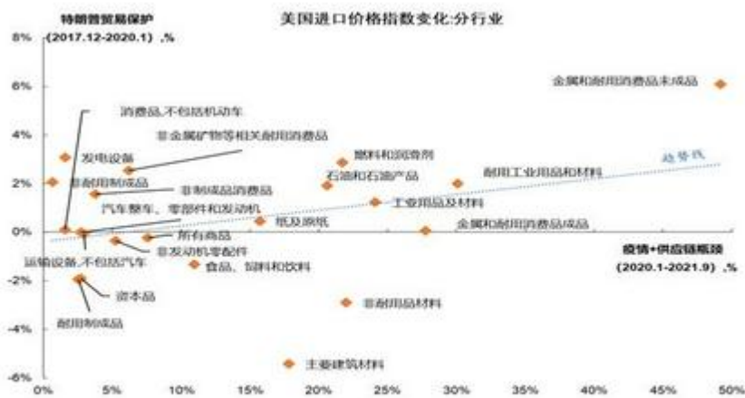
图 1 美国受特朗普贸易保护而涨价较明显的进口产品，受疫情与供应链瓶颈的影响相对较大

关税如何放大供应链瓶颈问题？我们观察到，美国受特朗普贸易保护而涨价较明显的进口产品，受疫情与供应链瓶颈的影响也相对较大。假设 2017 年 12 月至 2020 年 1 月期间美国进口价格指数涨幅主要受特朗普时期的关税影响，而 2020 年 1 月至 2021 年 9 月的进口价格主要受本轮疫情及供应链瓶颈的影响，对比两组数据可见，关税影响和供应链瓶颈影响较大的行业有一定正相关性。例如，在美国进口商品中，金属和耐用消费品未成品（关税涨价 6.1%、供应链瓶颈涨价 49.2%）、耐用工业用品及材料（关税涨价 2.0%、供应链瓶颈涨价 30.1%）等商品类别，可能同时受关税和供应链瓶颈的扰动而涨价。这说明，受加征关税影响较大的产品，也遭遇了更严重的供应链瓶颈问题，产品的涨价可能造成了更严重的短缺。这也意味着，下调关税或许能够在一定程度上缓解供应链瓶颈带来的涨价压力。